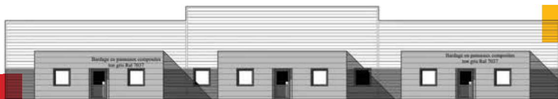
Minimex aluminium lagat gite R04 7024 FACADE EST

Moderne, confortable et facile d'accès, le gîte d'entreprises de Lagat répond ainsi aux dernières normes environnementales.